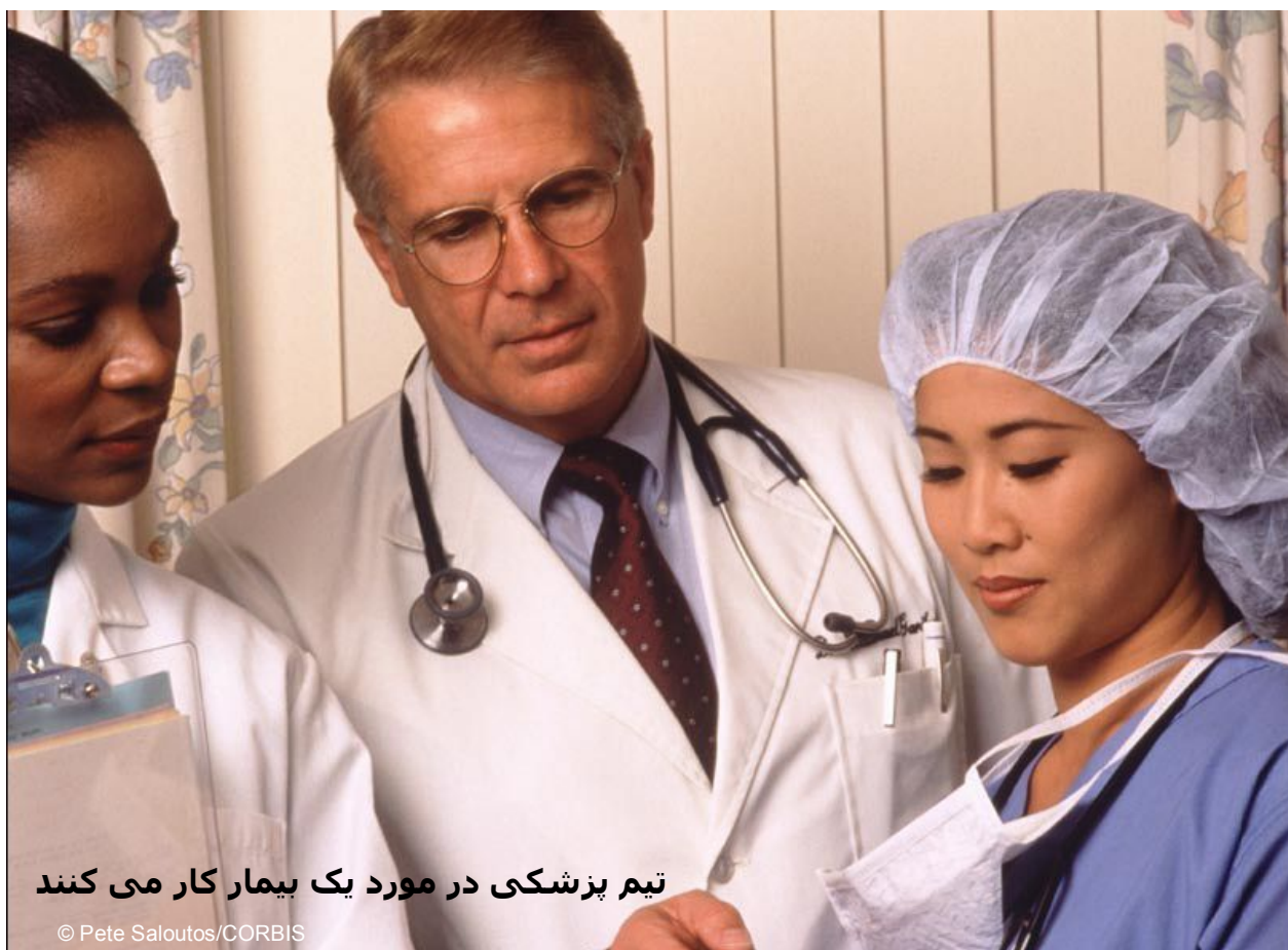
تیم پزشکی در مورد یک بیمار کار می کنند